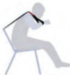
Cinturón para comer