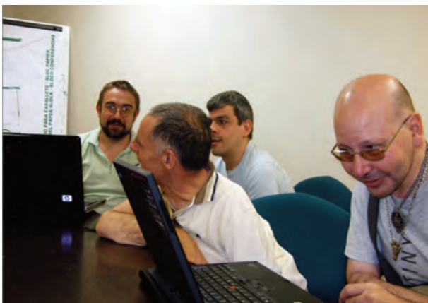
Sesión formativa con la Asociación Acuario.

A lo largo de 2010, hemos facilitado el acceso a herramientas web de colaboración y comunicación a colectivos de personas con discapacidad física severa. También a otros colectivos cuyas oportunidades vitales pueden verse claramente incrementadas si acceden eficazmente a dichas herramientas: personas sin hogar, asociaciones de voluntarios que trabajan en el ámbito de la exclusión social, etc.