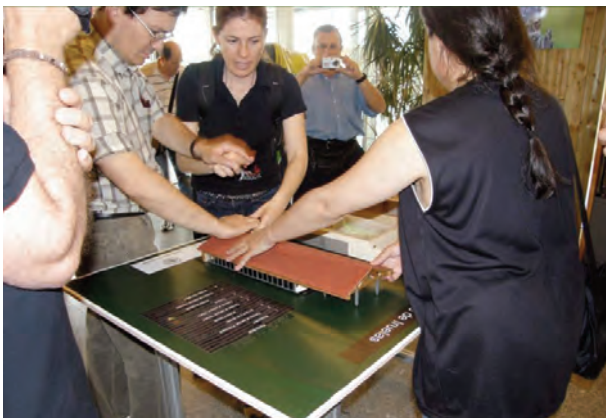
Visitantes en la Casa del Parque

Nuestra propia exposición resultará de los comentarios sobre esas pinturas. Lo divertido es que nunca se encuentran dos representaciones iguales. Visitamos el rincón de la memoria, y aliviarnos las profundas cicatrices de un pino resinero con una caricia egoísta que desea saber su edad. Los monitores nos enseñan a preguntarle. Vemos a alguien con un ciempiés en sus manos intentando saber si el nombre se acerca a la realidad. Audiovisuales narrados, lectura en Braille, dibujos en alto-relieve... son otros elementos que nos acompañan para no perder detalle.