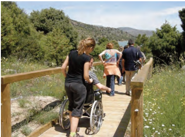
Recorrido accesible por el Parque (1)

(1) Fotografías cedidas por la Casa del Parque de la Reserva Natural del Valle de Iruelas