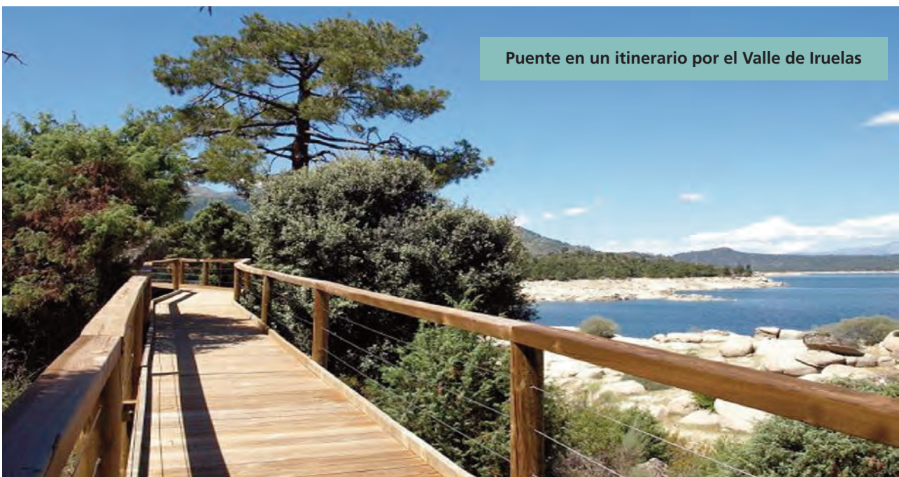
Puente en un itinerario por el Valle de Iruelas